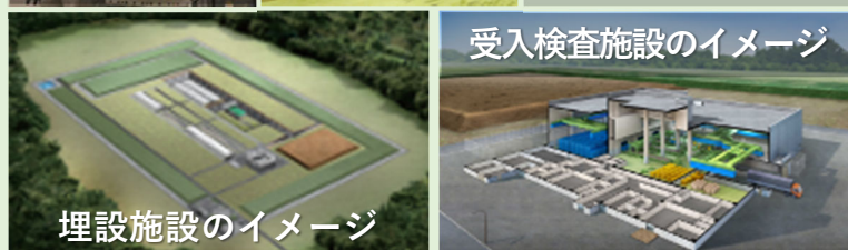
埋設施設のイメージ