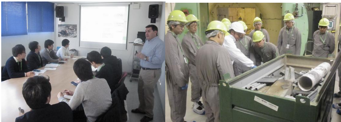
現地技術者との技術交流