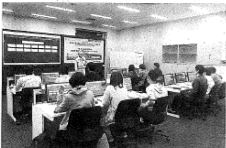
原電の研修施設での原子炉シミュレーター実習

するか」といった事前課題が課されるなどハイレベルな内容。本書ではシミュレーターで運転炉についての基礎知識を学んだほか、理学講習で廃止措置について学会発表の要