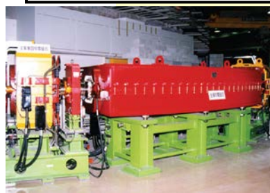
重粒子癌治療装置 HIMAC