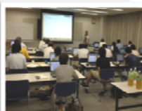
テキストコミュニケーション演習