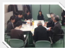
経験者と意見交換