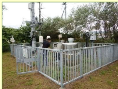
固定局測定機器の点検等