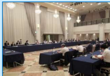
監視協議会(安全対策確認)