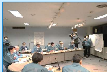
原子力防災訓練(知事参加)