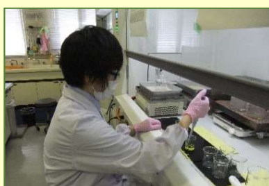
③薬品を加え化学処理