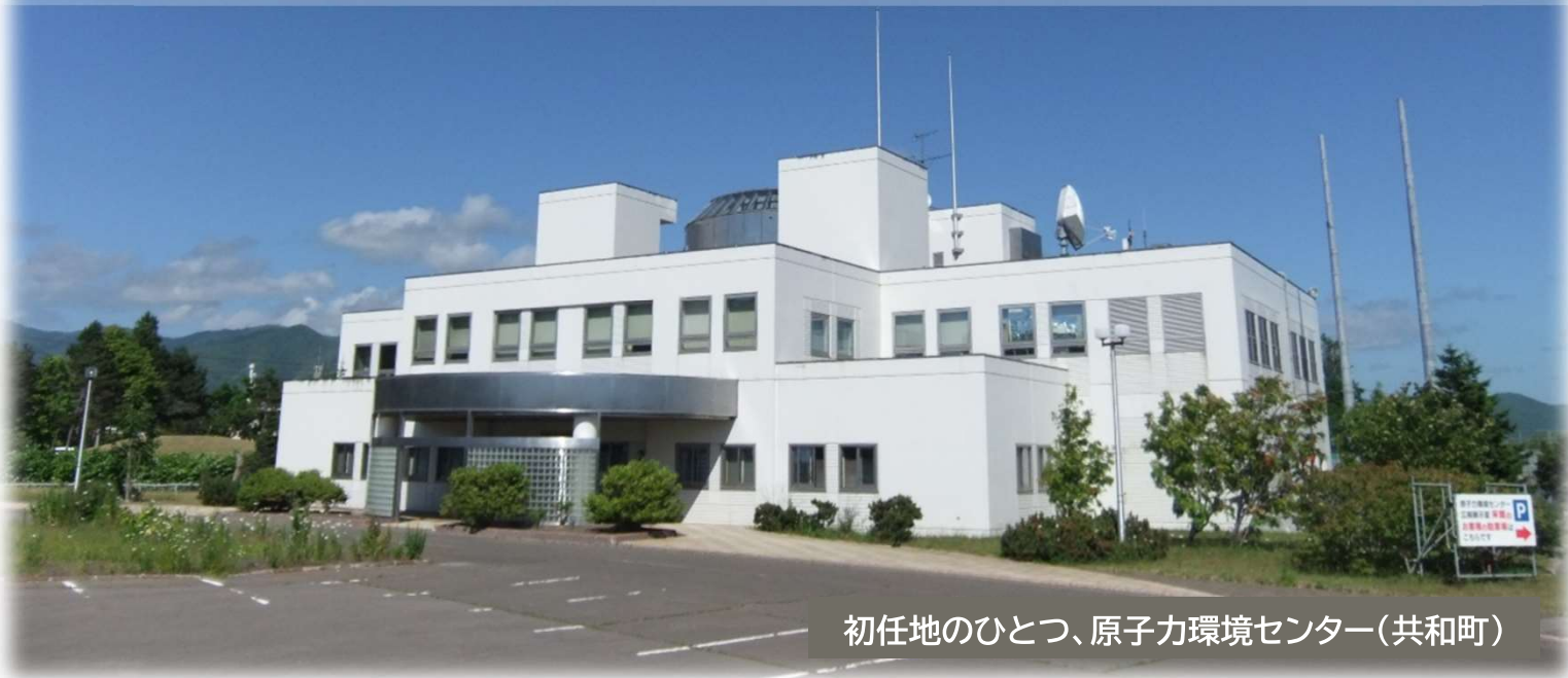
初任地のひとつ、原子力環境センター(共和町)