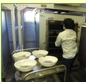
②灰化处理(試料の濃縮)