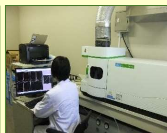
④測定機器による分析