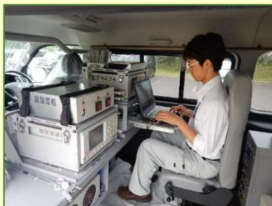
車載機器による測定