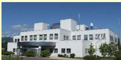
空間放射線の監視