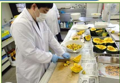
①前処理(燃焼しやすく粉砕し計量)