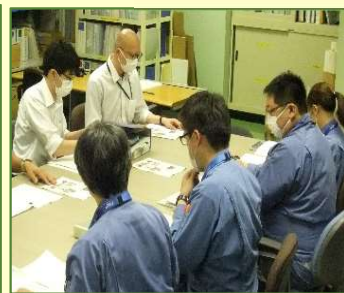
泊発電所からの報告聴取