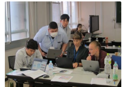
グループワーク風景

研修生は、2050年時点で会社が大きく成長しているためには今後どのような事業を展開すべきか、それによりどのような会社となっているかを経営層(と想定する会場聴衆)にプレゼンテーションする。